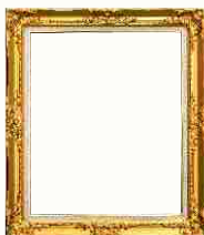
Grande Procurador Adjunto - Ilustríssimo Ir.